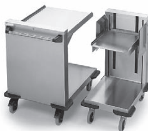
PO-SV 2/1 PO-TA 1/1 mit seitlicher Tablettführung für Abstapelung

Plattformstapler aus Edelstahl mit einer Plattform. Zuladung max. 200 kg. Kipp- und verkantungsicher geführt. Federkraft einstellbar je nach Geschirr-/Tablettgewicht. Sicherheitsschiebegreif. 4 Stoßbecken. Rostfreie Rollenausstattung gemäß DIN 18867, Teil 8. Raddurchmesser 125 mm. 2 Lenkrollen, 2 Lenkstopprollen. Stapelhöhe ca. 575 mm.