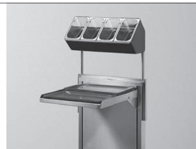
Besteckaufsatz mit Besteckbehältern