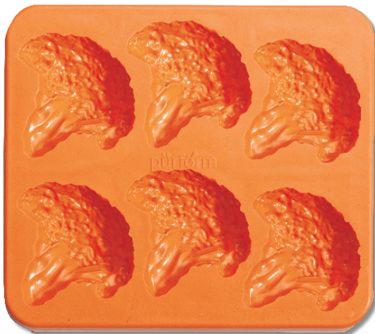
Siliconform Broccoli Bestellnr.: G-10050