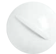
Cloche für Gourmetteller cloche for gourmet plate 16 cm Art.Nr. 87 7636