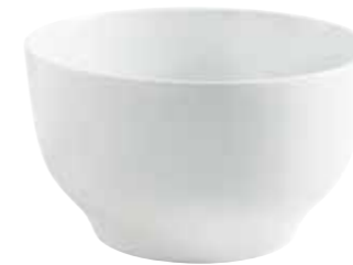
Schüssel bowl 23 cm, 3,80 l Art.Nr. 55 2904