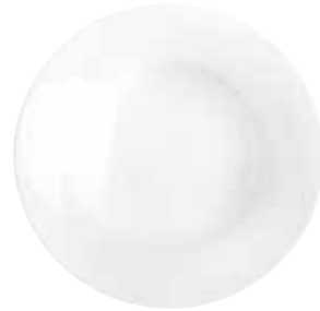
Suppenteller soup plate 24 cm Art.Nr. 55 3416