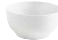
Schüssel bowl 15 cm, 0,90 l Art.Nr. 55 2997