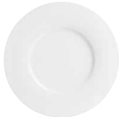
Platzteller show plate 31 cm Art.Nr. 55 3432