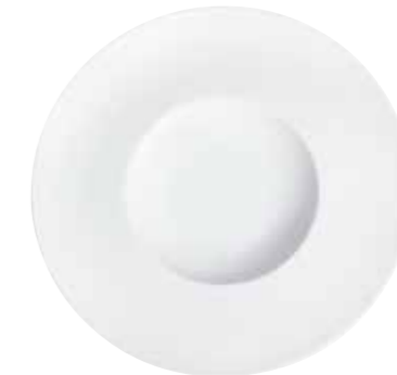
Gourmetteller gourmet plate 30 cm Art.Nr. 87 3414