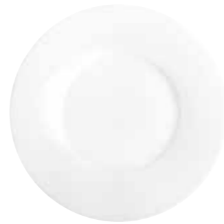
Essteller dinner plate 27 cm Art.Nr. 55 3429