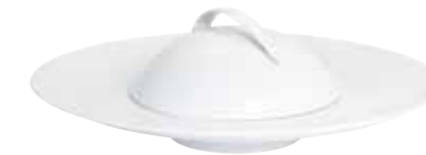
Gourmetteller mit Cloche gourmet plate with cloche Art.Nr. 55 D267