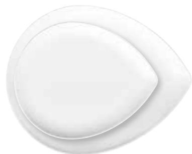
Platte midi platter medium 24 cm Art.Nr. 55 3361