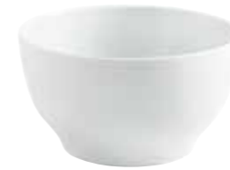
Schüssel bowl 19 cm, 1,70 l Art.Nr. 55 2902