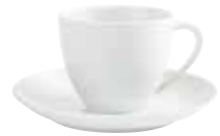
Kaffee-Obertasse coffee cup 0,21 l Art.Nr. 55 4704 Untertasse/ saucer 15 cm Art.Nr. 55 3504