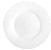
Brotteller bread plate 17 cm Art.Nr. 55 3400