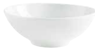
Schale maxi bowl large 16 cm, 0,60 l Art.Nr. 55 2967