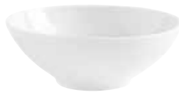
Schale midi bowl medium 13 cm, 0,35 l Art.Nr. 55 2965