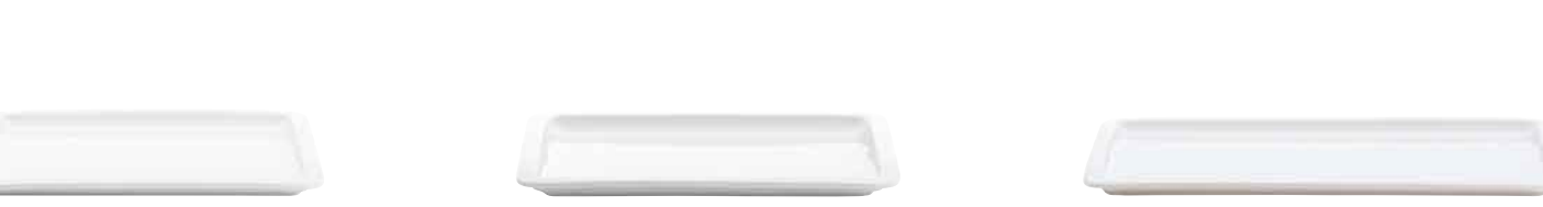
GN-Platte GN platter 2/3 20 mm 97 7824 GN-Platte GN platter 1/2 20 mm 97 7825 GN-Platte GN platter 1/1 20 mm 97 7815