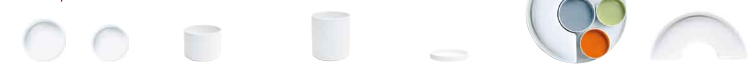
Schale Bowl 11 cm 20 6014 Schale Bowl 9 cm 20 6015 Schale Midi, stapelbar Bowl medium, stackable 0,5 l / 8 cm hoch 20 2718 Schale Maxi, stapelbar Bowl maxi, stackable 0,9 l / 12 cm hoch 20 2717 Deckelchen, stapelbar Cover, stackable 11 cm / 1,5 cm hoch 20 2809 Tablett, rund Tray, round 31 cm 20 7763 Schale, bogenförmig, stapelbar Bowl, arched, stackable 30 cm 20 7800