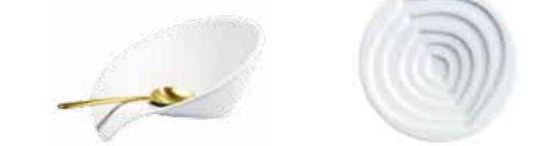
Buffetblüte Buffet blossom 15 cm 20 7830 Oliveölschälchen Olive oil bowl 10 cm 20 6013