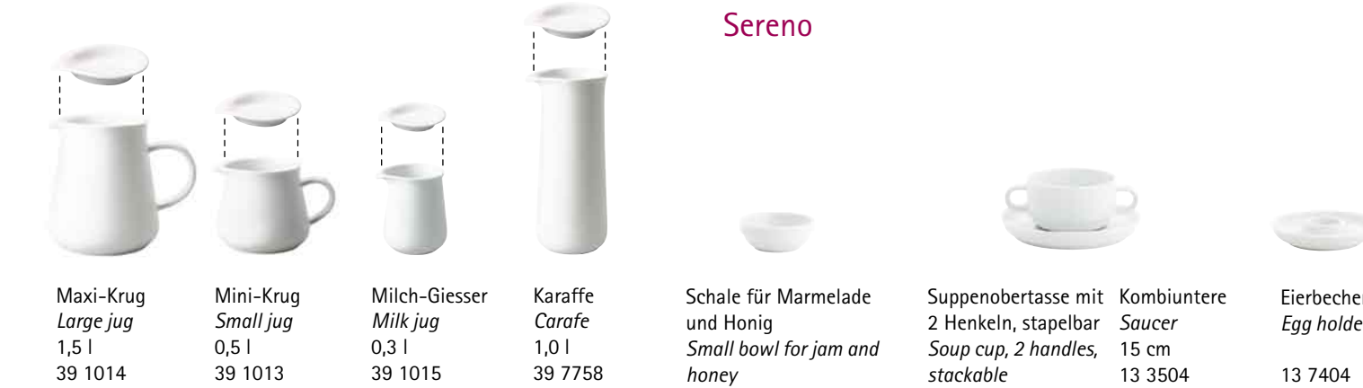
Maxi-Krug Large jug 1,5 l 39 1014 Mini-Krug Small jug 0,5 l 39 1013 Milch-Giesser Milk jug 0,3 l 39 1015 Karaffe Carafe 1,0 l 39 7758 Schale für Marmelade und Honig Small bowl for jam and honey 8 cm 13 6004 Suppenobertasse mit 2 Henkeln, stapelbar Soup cup, 2 handles, stackable 0,25 l 13 5502 Kombiuntere Saucer 15 cm 13 3504 Eierbecher Egg holder 13 7404

Four round and two squared stands are an excellent presentation scene for fruits, desserts, petit fours and different culinary delights. They are attractive on the buffet, on the table and in hotel rooms for a little welcome gift. The racks can be used also with other plates than shown. Your KAHLA-Team will advise you.