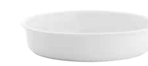
GN-Schale GN bowl 41,4 cm 97 7823