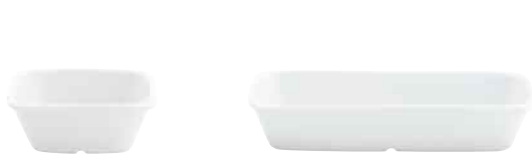
Schale, quadratisch Bowl, square 10 x 10 cm 11 2930 Schale, rechteckig Bowl, rectangular 20 x 10 cm 11 2929