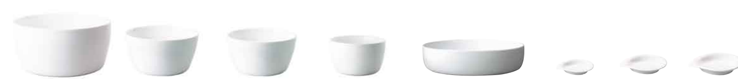
Maxi-Schüssel Large bowl 25 cm 39 2949 Midi-Schüssel Medium bowl 19 cm 39 2948 Midi-Schüssel Medium bowl 16 cm 39 2962 Mini-Schüssel Small bowl 14 cm 39 2947 Obst-/ Gemüseschale Vegetable bowl 32 cm / 5,0 L 39 2966 Mini-Dip Small dip 9 cm 39 7756 Midi-Dip Medium dip 11 cm 39 7757 Maxi-Dip Large dip 13 cm 39 7755