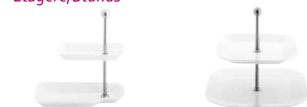
Cumulus, Deli-Etagère (Tablett 23cm, Platte 18x9 cm) Cumulus, deli stand (Tray 23cm, platter 18x9 cm) 42 7814 Cumulus, 2 Etagen (27cm, 22cm) Cumulus, 2 platters (27cm, 22cm) 42 7813