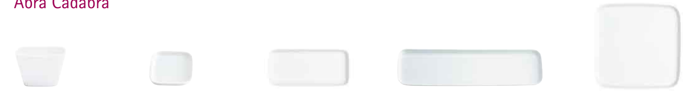
Kleine Schale, eckig small bowl, square 6 x 6 cm 20 6010 Deckelchen, eckig lid, square 10 x 10 cm 20 7761 Tablett, rechteckig Tray, rectangular 20 x 9 cm 20 7745 Tablett, extra lang Tray, extra long 44 x 11 cm 20 7762 Tablett, quadratisch Tray, square 24 x 24 cm 20 7744