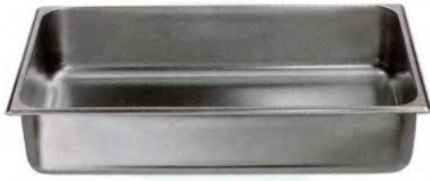
GN-Schale 1/1-065 / 530 x 320 mm CNS