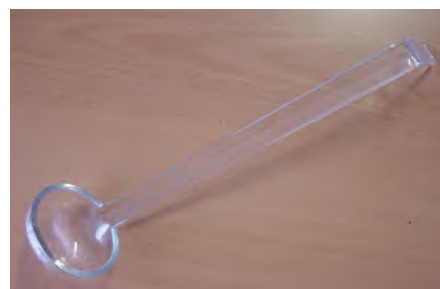
Schöpflöffel Ø 50 / L 267 mm, Cambro Klar