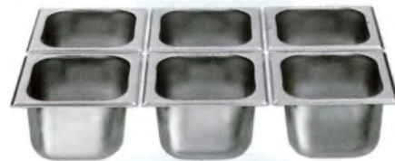
GN-Schale 1/6-100 / 176 x 162 mm CNS