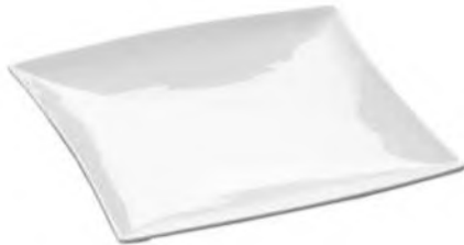
Teller Quadratisch 18 cm, Porzellan weiss Uni