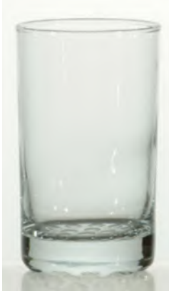
Nobhill Becher 26cl / Ø 65 / H 114mm, 2dl Ge- eicht