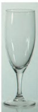
Elegance Flute 13cl / Ø 48 / H 180mm