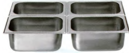
GN-Schale 1/4-100 / 265 x 162mm CNS