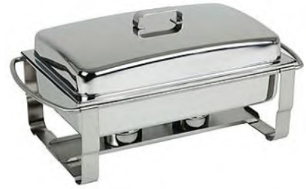
Chafing-Dish GN 1/1 ohne Schalen Und Brenner

Wasserbad Chafing-Dish Edelstahl 18/10, Einsatzschalen und Brenndosen separat bestellen!