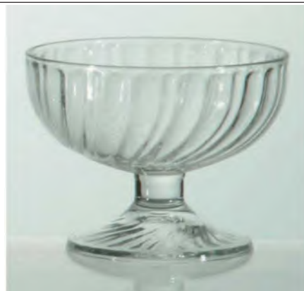
Sorbet Dessert 38cl / Ø 117 / H 95mm