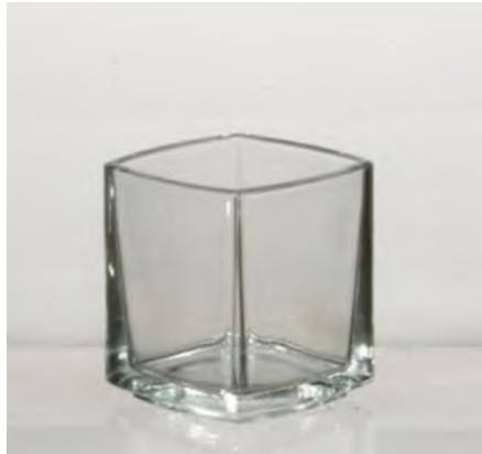
Universalglas Kube 10 cl / Ø 58/ H 68 mm