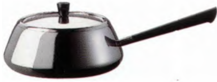
Fondue-Bourg Pfanne CNS