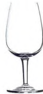
Doc Fussglas 12 cl / Ø 54mm / H 136mm, 2+4 Geeicht