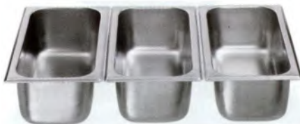
GN-Schale 1/3-100 / 325 x 176 mm CNS