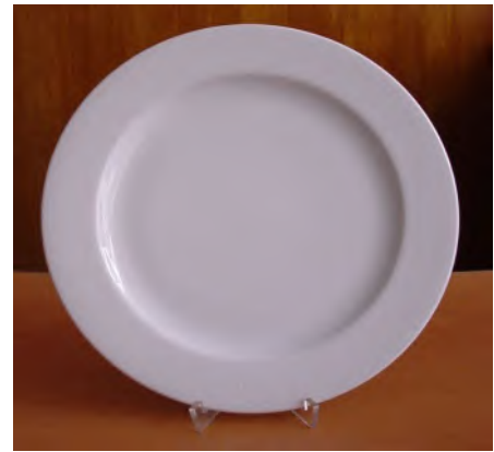
Teller Flach Ø 26 cm Tavola / System Plus weiss