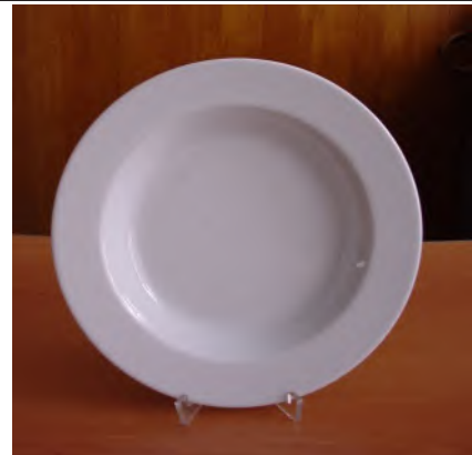
Teller Tief Ø 23 cm weiss Uni System Plus