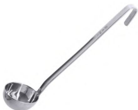
Schöpflöffel Ø 8 cm / 0.12 lt Fugenlos, CNS

Aus Edelstahl 18/10, matt poliert, schwere Qualität