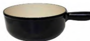
Fonduekachel Ø 21 cm, Gusseisen schwarz