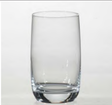
Vigne Wasserbecher 33cl / Ø 65 / H 126mm