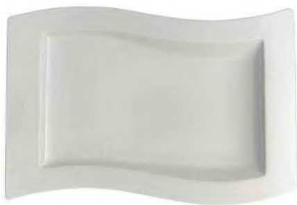
Teller Flach Rechteckig 33x24cm, Newwave