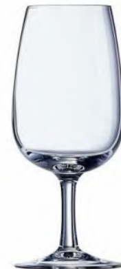
Viticole Weinkelch 21.5cl / Ø 65 / H 155mm, 1dl+