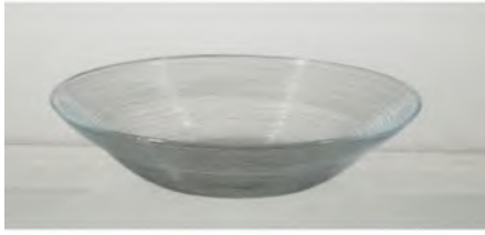
Circle Teller Tief Ø 20 cm