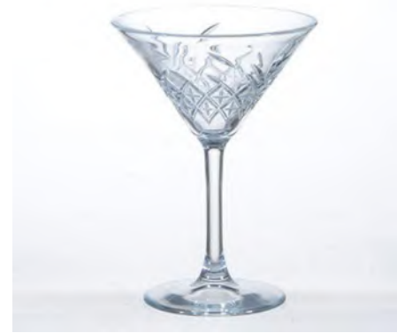
Timeless Martinichelch 230 ml / Ø 116 / H 172 mm