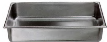
GN-Schale 1/1-100 / 530 x 320 mm CNS, Gelocht

Gelochte Normschale passend zu Chafing-Dish