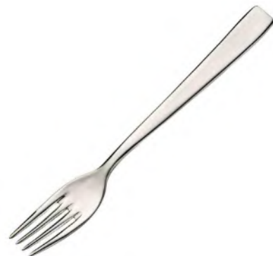
Gemüse gabel CNS 18/10 Gamma / America / Sirio