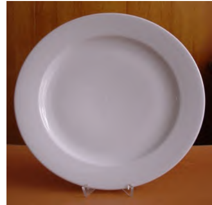
Teller Flach Ø 30 cm Tavola / Pronto weiss