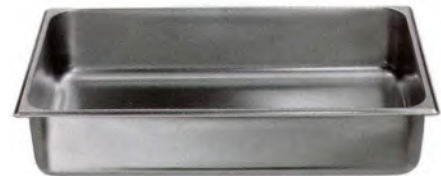
GN-Schale 1/1-100 / 530 x 320 mm CNS