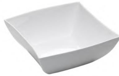
Gourmetschale 4-Eckig, Tief 18 cm / 1 lt weiss Uni