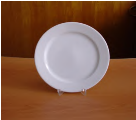
Teller Flach Ø 16 cm Tavola weiss Uni