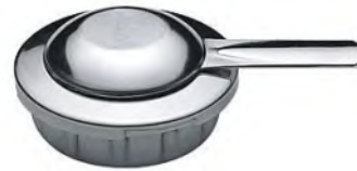
Brenner für Brennpaste zu Fondurechaud