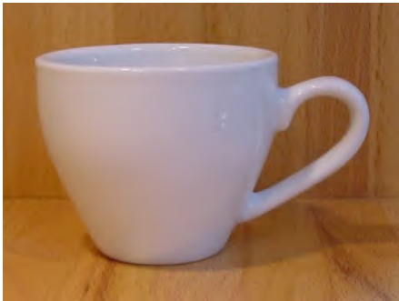
Obertasse Mokka 10 cl Italia weiss