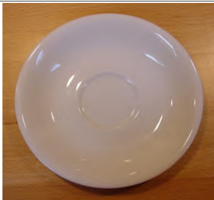
Untertasse Mokka Ø 11.5 cm Italia weiss