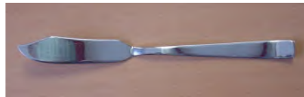
Fischmesser CNS 18/10