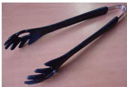
Salat- / Servierzange L 23cm Handy, schwarz

Universalzange aus hitzebeständigem Kunststoff