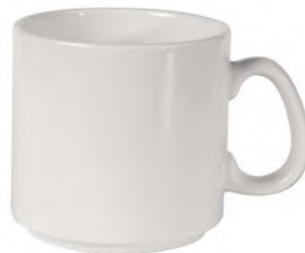
Kaffeebecher Mug 30 cl Diamant weiss