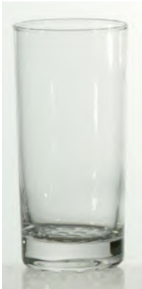
Nobhill Becher 35cl / Ø 66 / H 147mm, 4cl Ge- eicht