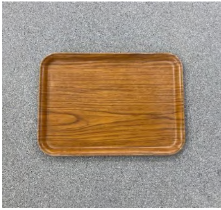
Serviertablett Braun 42 x 32 cm