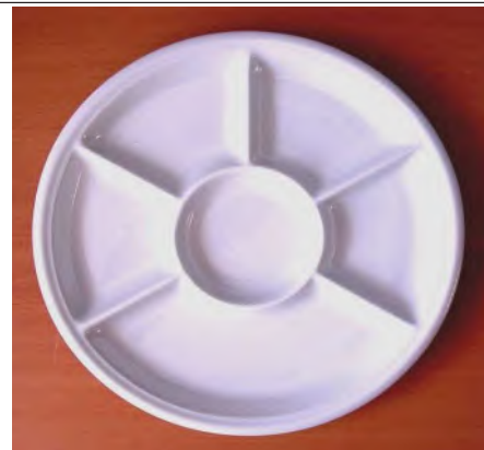
Abteilteller Bourg. Ø 26 cm / 6-Abteil weiss

Hotelhartporzellan; für Fleisch- und Fischfondue