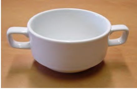
Suppentasse Stapel 26 cl Tavola weiss Uni