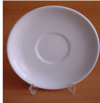
Untertasse Kombi Tavola weiss