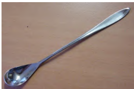
Limolöffel Karina Rostfrei