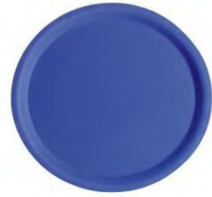
Serviertablett Ø38cm, Rutschfest Gummiert, blau

Rutschfeste Naturkautschukbeschichtung, glasfaserverstärkt