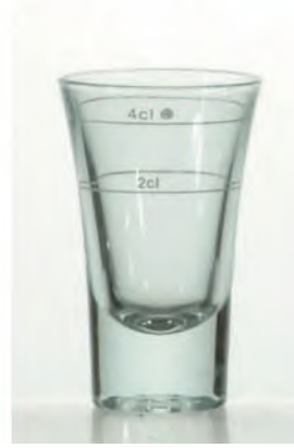
Dublino Likör 5.7cl / Ø 50 / H 90mm, 2+4cl Ge- eicht