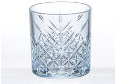
Timeless Whiskybecher 345 ml / Ø 86 / H 96 mm