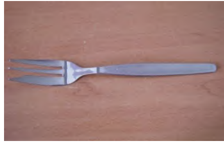
Kuchengabel Inox club, L 13.5 mm