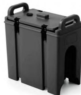
Heisshaltegerät Thermo 18 lt. mit Ablasshahn

Isolierte Camtainer halten Getränke stundenlang heiss oder kalt