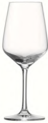
Taste weisswein / Sekt 0, 36 cl / Ø 79 / H 211 mm