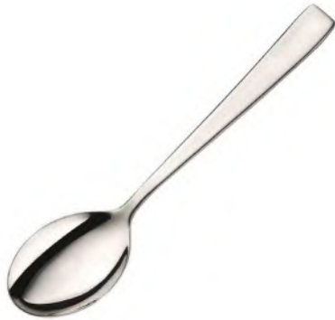
Gemüselöffel CNS 18/10 Gamma / America / Sirio