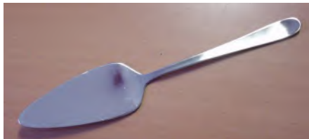
Tortenheber CNS 18/10 Berlin / Gamma / Pitagora