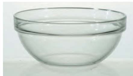
Arcoroc Saladier Stapel Ø 200mm