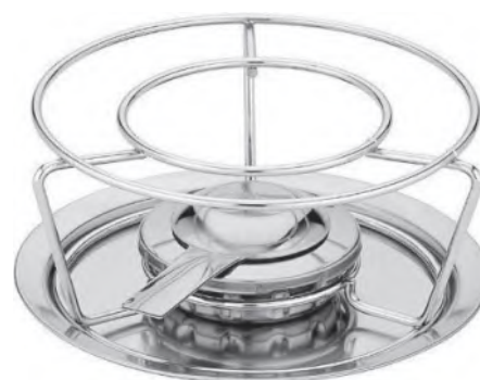
Fondurechaud CNS ohne Brenner

Rechaud Chrom, Brenner oder Brenndosen separat bestellen