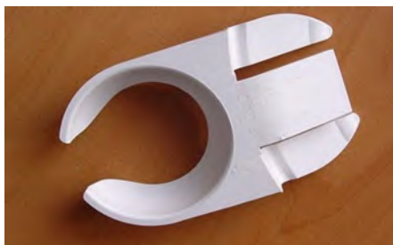
Party Tellerclip Kunststoff weiss

Als Gläserständer, zum Anklemmen an Tellern