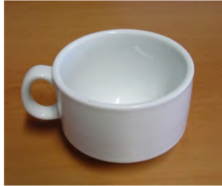
Obertasse Kaffee Stapel 20 cl Diamant weiss