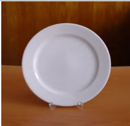
Teller Flach Ø 21 cm Tavola weiss