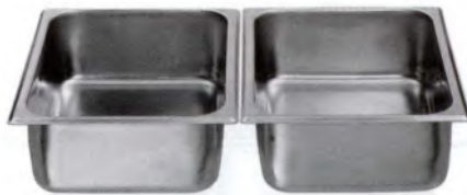
GN-Schale 1/2-100 / 325 x 265 mm CNS