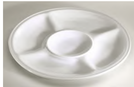
Abteilteller Bourg. Ø 26 cm / 5-Abteil weiss

Hotelhartporzellan; für Fleisch- und Fischfondue