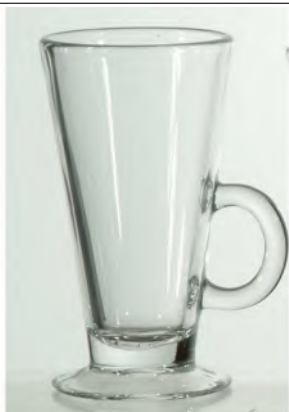
Acapulco Teebecher 28cl/ Ø 78 / H 150mm