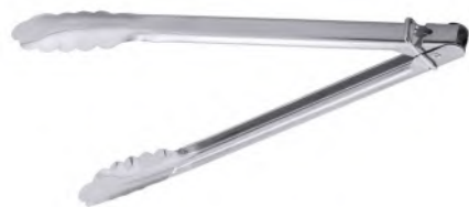
Allzweckzange L 30 cm CNS

Aus Chromstahl, mit Feder und Verschlusschieber