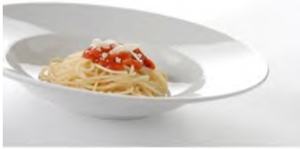
Pasta- / Gourmetschale Ø 27cm weiss, Gastro