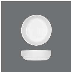
Kompottschale rund stapelbar , Fruit saucer round stackable, Compotier rond empilable, Compotera redonda apilable, Coppetta rotonda