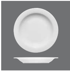
Teller halbtief Fahne , Plate half-deep with rim, Assiette demi-creuse à l'aile, Plato medio hondo con ala, Piatto semifondo