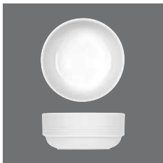
Suppenschale , Bowl, Bol, Bowl, Coppetta