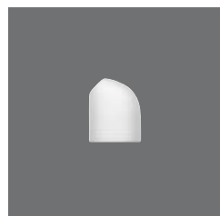
Salzstreuer , Salt shaker, Salière, Salero, Spargi sale

> Sauciere 80 3830 8075/0.30 0,30 (10.14) 153 (6.02) 78 270