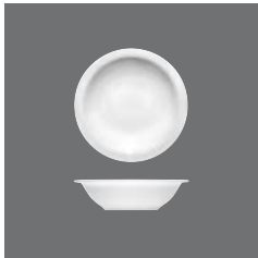
Kompottschale rund , Fruit saucer round, Compotier rond, Compotera redonda, Coppetta rotonda