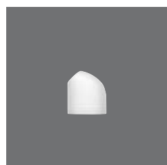
Pfefferstreuer , Pepper shaker, Poivrière, Pimentero, Spargi pepe

> Salzstreuer 80 4010 8028 - 54 (2.13) 66 70