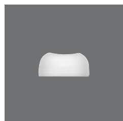
Leuchter , Candleholder, Bougeoir, Candelabro, Candeliere

> Ascher 80 7500 8091 - 90 (3.54) 33 / 327 150