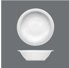
Salatiere rund , Salad dish round, Saladier rond, Ensaladera redonda, Insalatiera rotonda