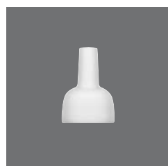
Tischvase , Flower vase, Vase à fleurs, Florero, Vaso per fiori

> Pfefferstreuer 80 4020 8029 - 51 (2.01) 56 50