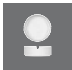
Ascher , Ashtray, Cendrier, Cenicero, Posacenere

> Tischvase 80 8100 8090 - 77 (3.03) 107 165