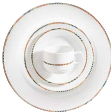
412980 Poppy Blau-Rot