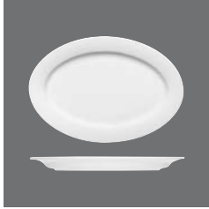
Platte oval Fahne , Platter oval with rim, Plat ovale à l'aile, Fuente oval con ala, Piatto ovale