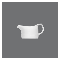
Saucenschälchen , Sauce-boat small, Saucière petite, Salsera pequeña, Salsiera

> Saucenschälchen 80 3810 8077/0.10 0,10 (3.38) 109 (4.29) 60 130