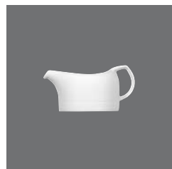
Sauciere , Sauce-boat, Saucière, Salsera, Salsiera

> Saucenschälchen 80 3810 8077/0.10 0,10 (3.38) 109 (4.29) 60 130