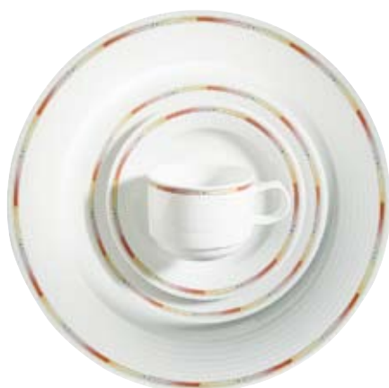
411340 Tina Rot-Gelb

Lagerdekor, Stock decoration, Décoration de stock, Decorado de stock, Decoro su articoli in magazzino