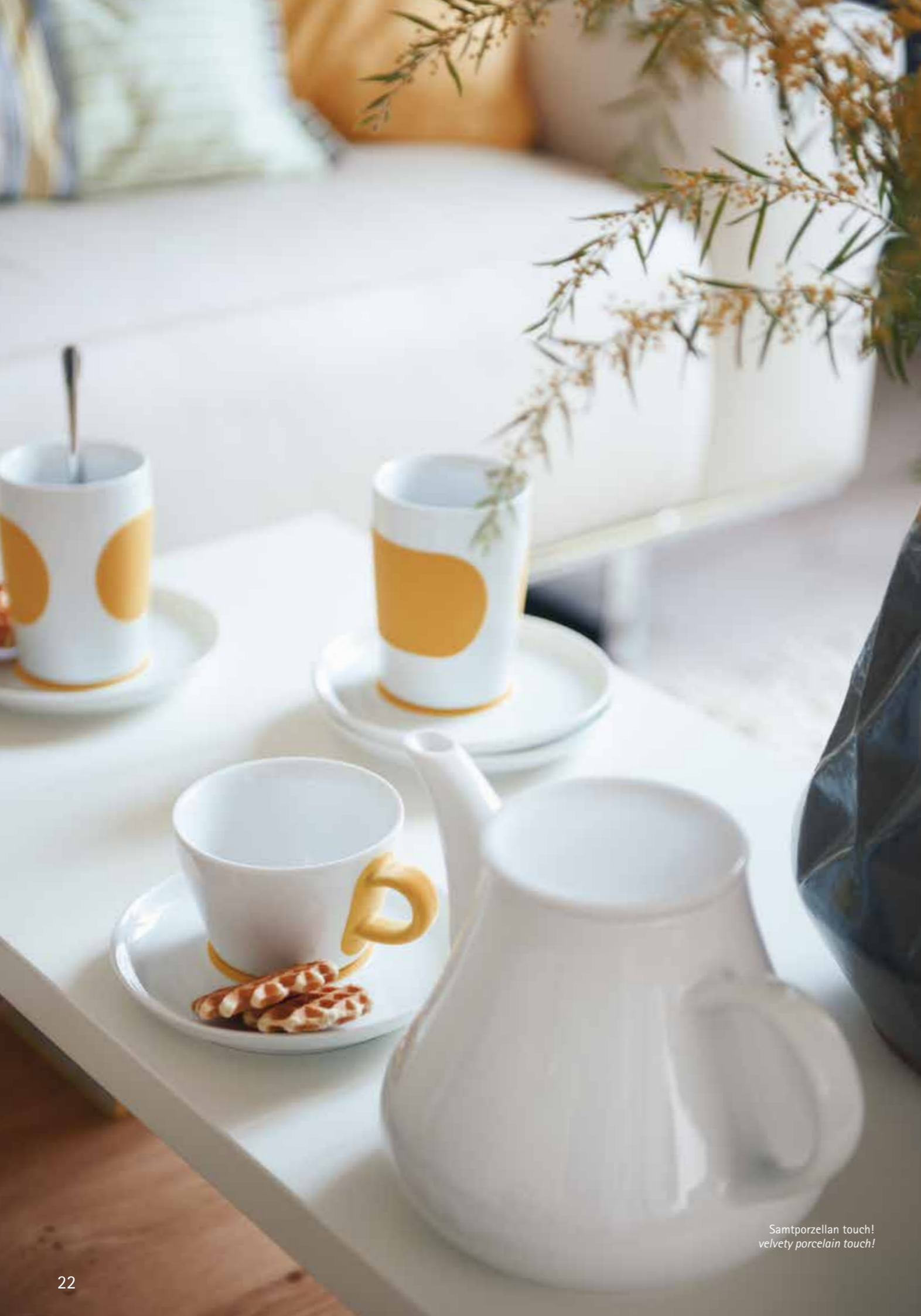
Samtporzellan touch! velvety porcelain touch!