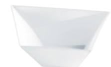
Schale Bowl 0,40 l Art. Nr. 19 2965