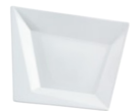
Midi-Platte Medium Platter 25 x 20 cm Art. Nr. 19 3355