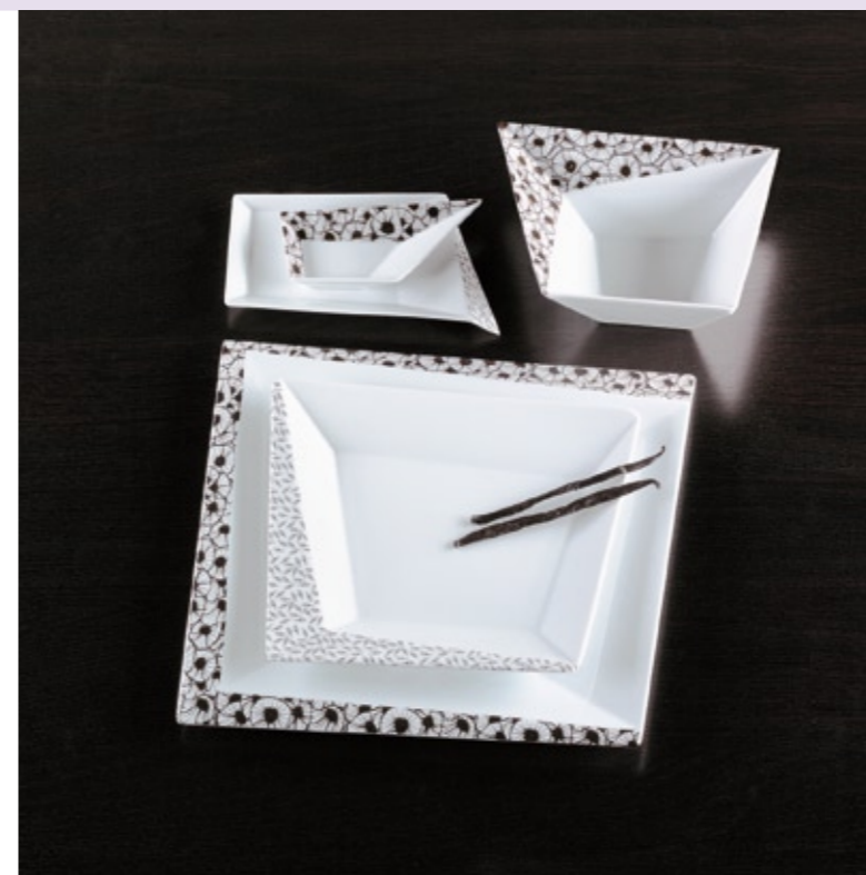
Dekor/décor OPUS#1: 70-439

Distinctive, multifunctional surfaces offer a charming interplay of light and shadow. The collection's exclusive demand is emphasised by a discreet brand signet as well as a perfect quality "Made in Germany".