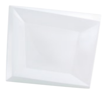
Maxi-Platte Large Platter 32 x 27 cm Art. Nr. 19 3354