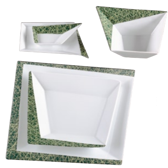
Dekor/décor OPUS#3: 73-364

Erhältlich ist OPUS in purem Weiß, mit einem dunkelbraunen Blütendekor aus Malven (OPUS#1) sowie mit einer modernen Netzstruktur in Kupfer (OPUS#2) oder Grün (OPUS#3), welche die architektonische Form des Porzellans perfekt unterstützt.