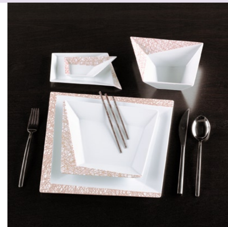
Dekor/décor OPUS#2: 73-365