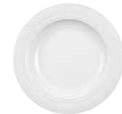
Teller, tief plate, deep 23 cm Art. Nr. 12 3416