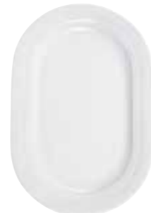
Platte, oval platter, oval 33 cm Art. Nr. 12 3315