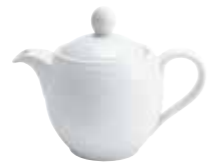
Kaffeekanne coffee pot 0,30 l Art. Nr. 12 1113