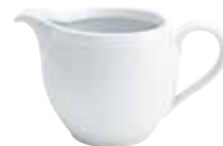
Milchkännchen milk jug 0,30 l Art. Nr. 12 1004