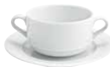
Suppen- Obertasse mit 2 Henkeln, stapelbar cup with 2 handles, stackable 0,25 l Art. Nr. 12 5502