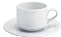
Kaffee-Obertasse, stapelbar, bordglasiert coffee cup, stackable, rim glazed 0,22 l Art. Nr. 12 5112