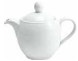
Teekanne tea pot 0,40 l Art. Nr. 12 1406