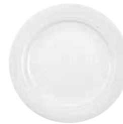
Teller, flach plate, round flat 16 cm Art. Nr. 12 3422