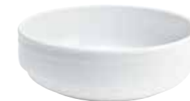
Schüssel, rund bowl, round 0,90 l 21 x 7 cm Art. Nr. 12 2903