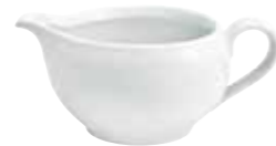
Saucière sauce boat 0,30 l Art. Nr. 12 3202