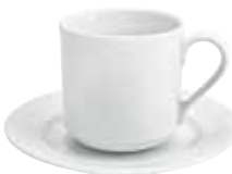
Kaffeebecher, stapelbar mug, stackable 0,28 l Art. Nr. 12 5305