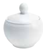
Zuckerdose mit Einschnittdeckel sugar bowl with lid 0,25 l Art. Nr. 12 2007