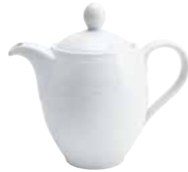
Kaffeekanne coffee pot 0,60 l Art. Nr. 12 1102