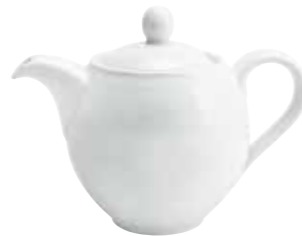
Teekanne tea pot 0,70 l Art. Nr. 12 1404