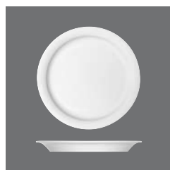
Teller flach schmale Fahne , Plate flat with narrow rim, Assiette plate avec l'aile étroite, Plato llano con ala estrecha, Piatto piano con falda stretta