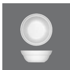
Bowl , Bowl, Bol, Bowl, Zuppiera piccola