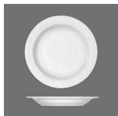
Teller halbtief Fahne , Plate half-deep with rim, Assiette demi-creuse à l'aile, Plato medio hondo con ala, Piatto semifondo