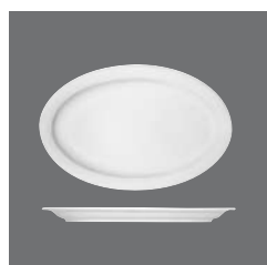
Platte oval Fahne , Platter oval with rim, Plat ovale à l'aile, Fuente oval con ala, Piatto ovale