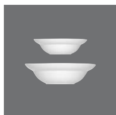
Salatiere rund , Salad dish round, Saladier rond, Ensaladera redonda, Insalatiera rotonda