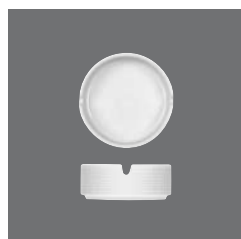
Ascher , Ashtray, Cendrier, Cenicero, Posacenere

> Tischvase 25 8100 2590 - 74 (2.91) 124 175