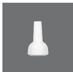
Tischvase , Flower vase, Vase à fleurs, Florero, Vaso per fiori

> Pfefferstreuer 25 4021 2529 - 53 (2.09) 89 105