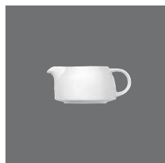
Sauciere , Sauce-boat, Saucière, Salsera, Salsiera

> Suppenschale 25 6512 2558/12 0,38 (12.85) 119 (4.69) 52 / 383 310