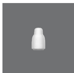
Pfefferstreuer , Pepper shaker, Poivrière, Pimentero, Spargi pepe

> Salzstreuer 25 4011 2528 - 53 (2.09) 89 105