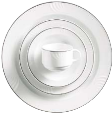
800144 Farblinie Schwarz