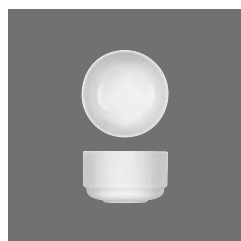
Bowl rund , Bowl round, Bol rond, Bowl redondo, Coppetta rotonda

> Bowl rund 0.27 25 6510 2558/0.27 0,27 (9.13) 95 (3.74) 56 / 456 195