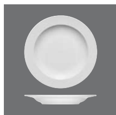
Teller tief Fahne, Plate deep with rim, Assiette creuse à l'aile, Plato hondo con ala, Piatto fondo