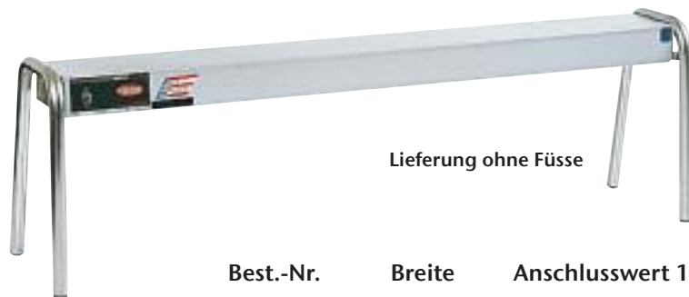
Lieferung ohne Füße

Ausführung Goldfarben Best.-Nr. 114.430 CHF 485.- / R 1