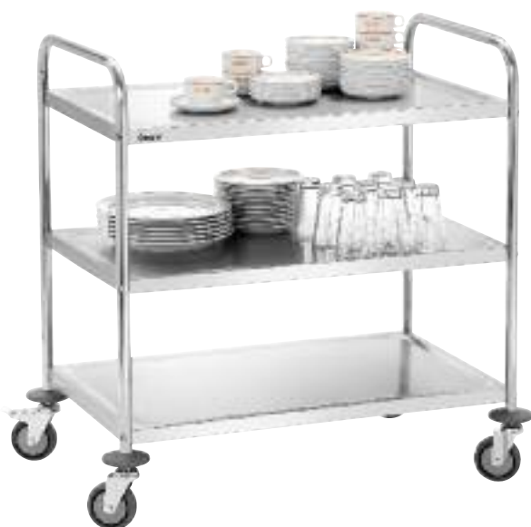
Servier-/Transportwagen TS 301 mit 3 Borden Material: Chromnickelstahl Ausführung: Rahmen aus Rundrohr, Ø 25,8 mm Borde: 3, Masse, je: B 827 x T 510 mm Abstand zwischen den Borden: 265 mm Tragfähigkeit max.: 90 kg gesamt, 30 kg pro Bord 4 gummbereifte Lenkrollen, Ø 100 mm, je 1 Radpuffer, 2 mit Feststellern Bausatz, einfache Montage Masse: B 920 x T 600 x H 945 mm Gewicht: 13,4 kg Best.-Nr. A300.073 CHF 198.- / R 1