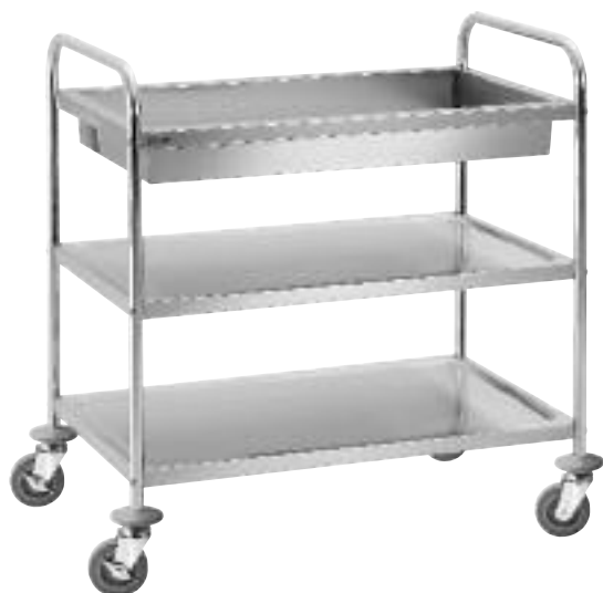
Servier-/Transportwagen TS 210 mit 2 Borden und extra tiefer Abräummulde Chromnickelstahl 4 Lenkrollen mit 2 Feststellern Tragfähigkeit: ca. 100 kg B 920 x T 600 x H 945 mm Bordmasse: ca. B 830 x T 510 mm Abräummulde innen: B 760 x T 440 mm, 100 mm tief Masse zwischen den Borden: oberes Zwischenmass 270 mm, unteres Zwischenmass 265 mm (Bausatz, einfache Montage) Gewicht: 14.1 kg Best.-Nr. A300.056 CHF 230.- / R 1