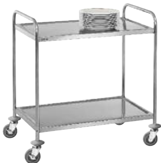
Servier-/Transportwagen TS 200 mit 2 Borden Chromnickelstahl 4 Lenkrollen mit 2 Feststellern Tragfähigkeit: 100 kg B 920 x T 600 x H 945 mm Bordmasse: ca. B 830 x T 510 mm Mass zwischen den Borden 570 mm (Bausatz, einfache Montage) Gewicht: 10 kg Best.-Nr. A300.062 CHF 160.- / R 1