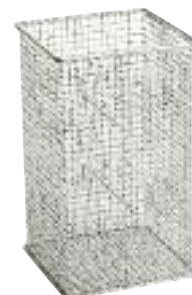
Küchenzubehör Einsatz Masse: 150/150 mm - aus CNS Best.-Nr. 712017 CHF 89.- / R 3