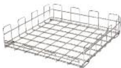
Grundkorb 550/610 mm aus CNS Best.-Nr. 41305 CHF 319.- / R 3