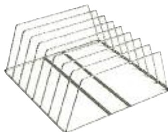
Backbleche Einsatz für 8 Backbleche Masse: 500/500 mm - aus CNS Best.-Nr. H324660 CHF 230.- / R 3